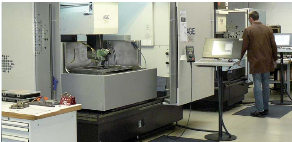
Die Vorteile der MDE werden bei Dettinger vor allem über die Erodiermaschinen sichtbar, die meist ja auch mannlos betrieben werden. So entfällt ein zeitaufwändiges Nachtragen der Zeiten.

Ein solches Handicap lag beispielsweise schon in der Vorkalkulation. Wurde die auf Grund des Aufwands zu zeitintensiv, hat man in der Vergangen-